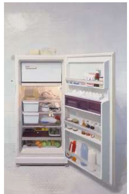
"Nevera nueva", 1994, d' Antonio López. Oli sobre tela de 240x 10 cm

https://www.cristianismejusticia.net/sites/default/files/pdf/eict30_0.pdf